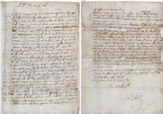
गॅलिलिओच्या हस्ताक्षरातील मूळ पत्र