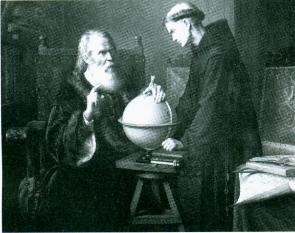
गॅलिलिओचे एक कल्पना चित्र

आधुनिक जग, हे ज्ञानाधिष्ठित (Knowledge Society) आहे असे आपण समजतो. अर्थातच इतिहासाचा अभ्यास केला तर हे विधान धाडसाचे आहे असे वाटायला लागते. जगातली कुठलीच प्रगती ही एखाद्या दशकात, शतकात, किंवा सहस्रकात झालेली नसते. अशी प्रगती ही कायमच होत असते. म्हणूनच प्रत्येक प्रगतीला भूतकाळ हा असतोच.